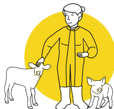
L'absence de stress